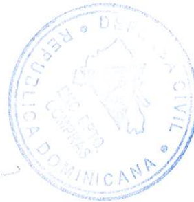
Melbin Rondón Brito Encargado de Compras. Defensa Civil